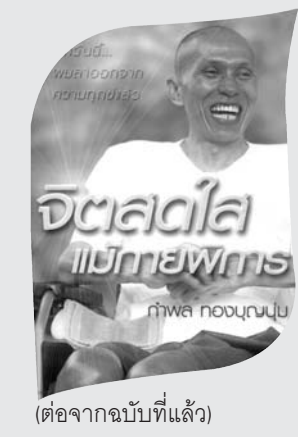
(ต่อจากฉบับที่แล้ว)

ตั้งนั้นการประพฤติปฏิบัติธรรมนั้น จึงว่าปฏิบัติที่ตัวเองไม่ต้องไปเข้าป่า เข้าดง เข้าภู เข้าถ้ำ ที่ลึกที่คนไม่พบไม่เห็นนั้นไม่ต้องไปอย่างนั้นก็ได้ อยู่ที่ไหนก็ได้ ตัวอาตมาเคยเข้าถ้ำ เข้าป่า เข้าภูมาแล้ว เคยไปนั่งกรรมฐานหลังตาภาวณา พุทโธ, สัมมาอรหัง, นัม ๑-๒-๓, พองยุบ, ดุลมหายใจ เคยทำมาแล้ว ชีวิตอันนั้นยังไม่มี ความสว่างในใจ ยังมีดอกมีดใจ ยังไม่รู้จักทิศทาง อาตมา (จะยกตัวอย่าง) เปรียบกับคนตกน้ำ ที่พูดให้ฟังมาแล้วหลายครั้งหลายหน คนตกน้ำนี่ เขาตกน้ำป้อมลงไปนี่จำเป็นมันต้องจมลงไปทันทีเลย น้ำท่วมหัวเลยนี่ เป็นอย่างนั้น ถ้าหากคนบางคนนะ จมลงไปถึงพื้นดิน (พื้นใต้น้ำ) โน่นเลย ถึงพื้นดินแล้วก็หลอนย่นขึ้น โผล่ขึ้นมา คนไม่เคยลอยน้ำ (ว่ายน้ำ) นี่ โผล่ขึ้นมายังไม่ทันได้พ่นน้ำดี มันหมดแรง (แรง) ที่เราย่นพื้นดินขึ้นมาเนี่ย เลยไม่ได้เห็นฝั่งเห็นขอบเห็นแดนน้ำนี่ ฝั่งอยู่ทางไหน จะไปทางไหนไม่รู้เลย จมบิว่ลงไปเลย นี่ก็เลยตายเลย เป็นอย่างนั้น ถ้าคนที่เคยลอยน้ำ (ว่ายน้ำ) เป็น ตกน้ำป้อมลงไปนี่ บางทีก็ไม่ถึง - ถ้าหากน้ำลึก (เมื่อ) ไม่ถึงดินมันก็จะฟุ้งขึ้นมา พอดีฟุ้งขึ้นมาพันหัวขึ้นมา มองดูไปเห็นฝั่งอยู่ข้างนั้น ข้างนี้ แล้วก็ลอย (ว่าย) ไป หน้อย หน้อยแล้วก็พ่นออกไปลอยไป แน่ะ! เป็นอย่างนั้น บางคนตกน้ำป้อมลงไป น้ำมันตื้นเพียงอกหรือเพียงคอเรานี้ ถึงดิน - ย่าง (เดิน) ไป แต่ถ้ำเป็นน้ำไหล บัดนี้ น้ำมันไหลอย่างที่น้ำโขง น้ำบ้านหลวงพ่อน้ำห้วย (ลำธาร) ห้วยสวयी มันนองมา (น้ำหลาก) จ้ำ (ยืน) ไม่อยู่