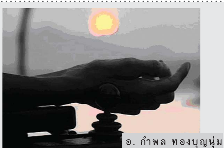
๑. กำพล ทองบุญนุ่ม

ท่านที่สนใจสามารถติดตามอ่านย้อนหลังได้ที่ http://www.baanaree.net/mag.php