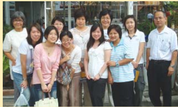
ขอร่วมอนุโมทนากับคณะปฏิบัติธรรม ณ วัดปลายา จ. ปทุมธานี เมื่อวันที่ ๑๖-๑๘ ตุลาคม ๒๕๕๒ ขอให้ทุกท่านเจริญในธรรมยิ่งขึ้น

หมายเหตุ : โครงการนี้ไม่มีค่าใช้จ่ายใดๆทั้งสิ้น