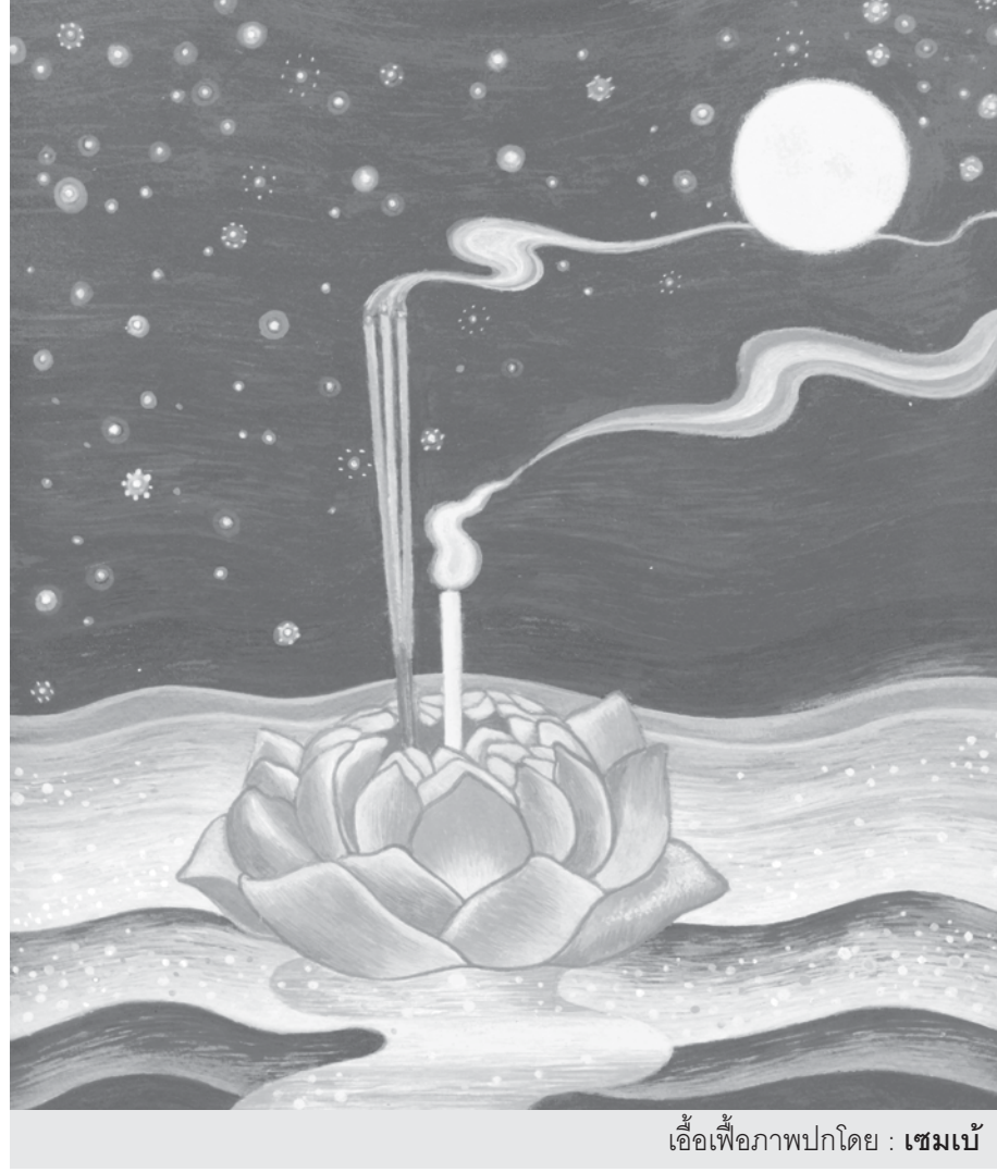
เชื้อเพื่อภาพปกโดย : เชมเบ้

ในพระสูตรนั้นเล่าโดยย่อว่าคราวหนึ่ง พระปุลณณะภิกษุได้เข้าเฝ้าพระเจ้าศาสตราในเขตวันมหาวิหารที่ศาลาลำไยด้วยพุทธบริษัท โดยนัยนั้นแปลว่าเมืองสาวัตถีนั้นไม่สัปปายะสำหรับท่าน จึงได้ขอประทานพระวโรกาสให้พระผู้มีพระภาคโปรดแสดงธรรมโดยย่อที่จะสดับแล้วมีความเพียร หลีกเร้นออกจากหมู่ แต่ก็ถึงซึ่งความไม่ประมาท และมีใจเด็ดเดี่ยว พระพุทธองค์ผู้เป็นบรมครูได้แสดงธรรมเทศนาที่ลัดสั้นโดยพลัน ว่าด้วยความเปลวเพลิงอันทำให้เป็นทุกข์ ไม่ว่าจะป็นสัมผัสทางตา หู จมูก ลิ้น กาย ใจ อันน่าปรารถนา น่าใคร่ น่าพอใจ น่ารัก ชักให้ใคร่ ชวนให้กำหนัดนั้นเมื่ออยู่ (ชื่อนี้ชัด ว่าพระพุทธองค์มีได้ตำหนิความมีอยู่ของสิ่งอันน่าปรารถนาทั้งหลาย) หากแต่เมื่อใดที่ภิกษุนั้นยินดี กล่าว